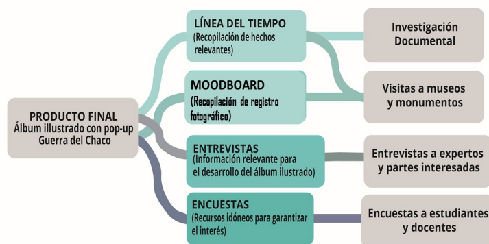
Figura 1: Modelo de recolección de información de la investigación orientada al desarrollo del producto final.

En resumen, se utilizó un enfoque mixto cualitativo-cuantitativo, aplicando técnicas de consulta documental y testeo de la población involucrada a través de encuestas y entrevistas. El procedimiento se basó en la compilación de información, la aplicación de cuestionarios y la creación de moodboards, con el objetivo de obtener datos relevantes para el desarrollo del álbum ilustrado con pop-up sobre la Guerra del Chaco.