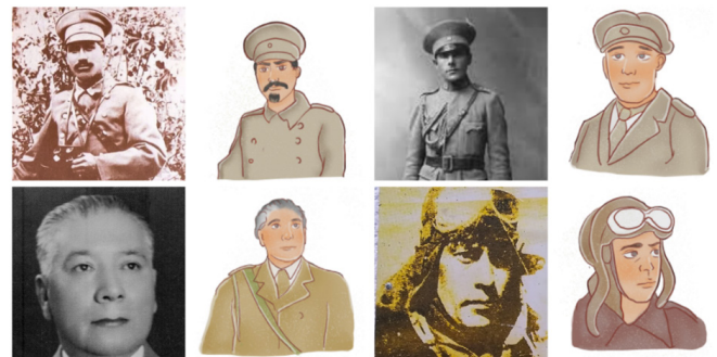
Figura 4: Registro fotográfico realizado en los museos de la Guerra del Chaco en la ciudad de Villa Montes