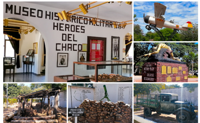
Figura 4: Registro fotográfico realizado en los museos de la Guerra del Chaco en la ciudad de Villa Montes

El resultado es un álbum que combina elementos visuales impactantes con interactividad, buscando despertar el interés, la creatividad y el aprendizaje de los niños al adentrarse en la historia de la Guerra del Chaco de una manera lúdica, con objetivos educativos definidos.