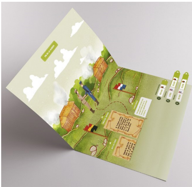
Figura 6: Mockups de páginas interiores del álbum ilustrado.

En conclusión, el álbum ilustrado con pop-up se muestra como una valiosa herramienta pedagógica para enseñar historia en el nivel primario. Este estudio respalda la implementación de este recurso, brindando recomendaciones prácticas para su diseño y destacando la necesidad de aumentar la disponibilidad de este tipo de medios en las Unidades Educativas. Con estas propuestas, se espera mejorar la práctica educativa y contribuir al enriquecimiento del conocimiento en el campo específico de la historia patria, fomentando así una educación más integral y significativa para los estudiantes.