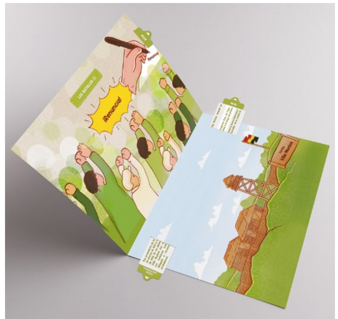
Figura 7: Mockups de páginas interiores del álbum ilustrado.